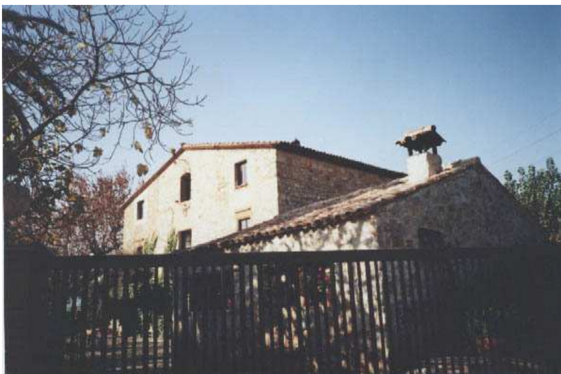
Vista general de l'antiga masia ( Desembre 1994 )