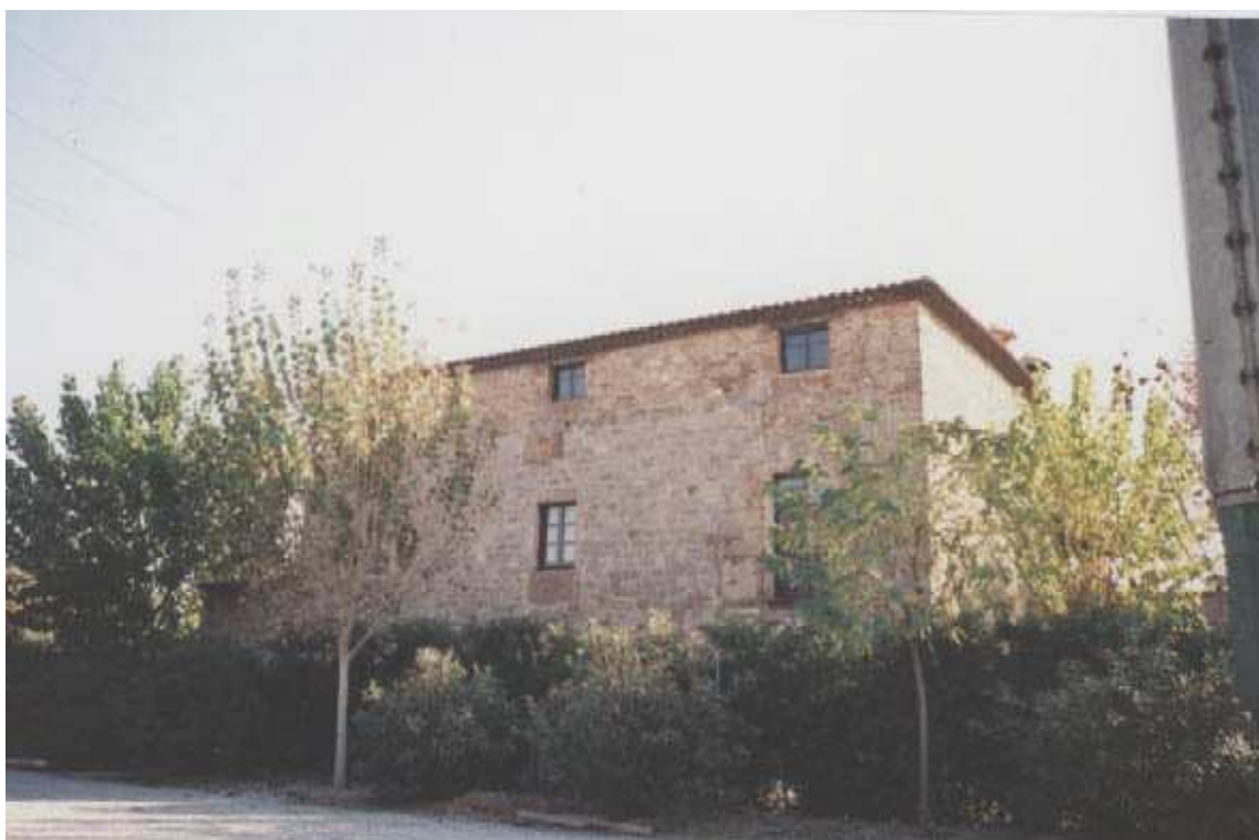
Vista general de La part posterior de l'antiga masia ( Desembre 1994 )