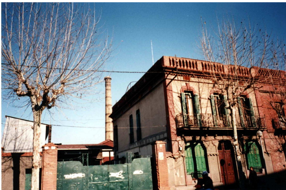
Vista de la caseta d'accés al recinte i de la xemeneia que es cataloga (Febrer 1995)