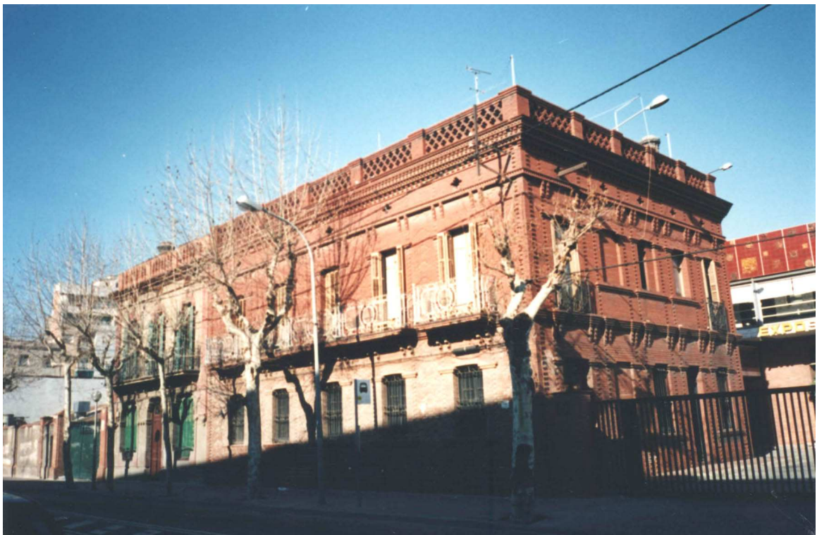
Casa del director situada a l' entrada del recinte ( Febrer , 1995 )