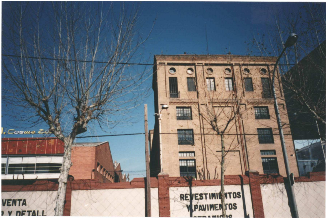
Nau principal projectada per Puig i Gairalt l'any 1923 ( Febrer 1995 )