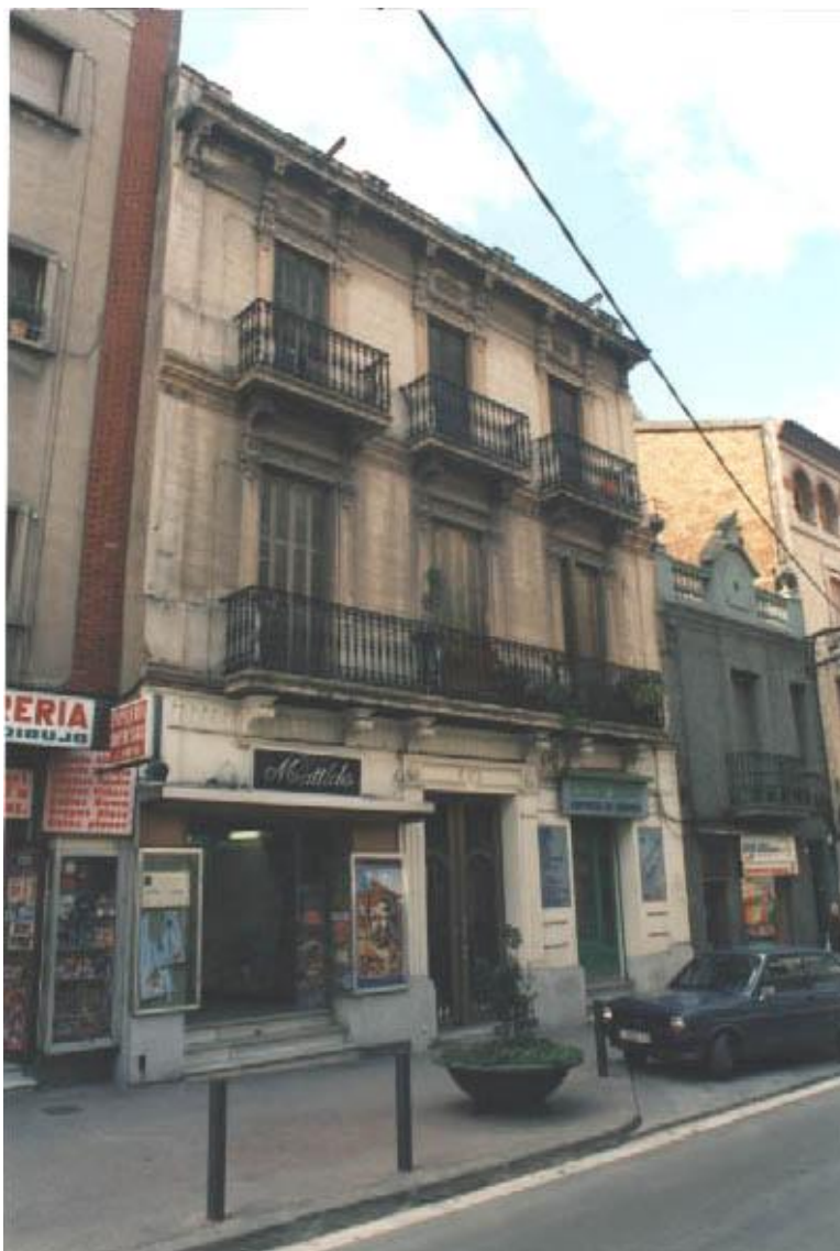
Vista general de la façana ( Abril 1996 )