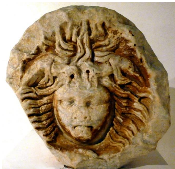
Figura 2 – Fotografia frontal de la Medusa original, exposada al Museu d'Arqueologia de Catalunya.