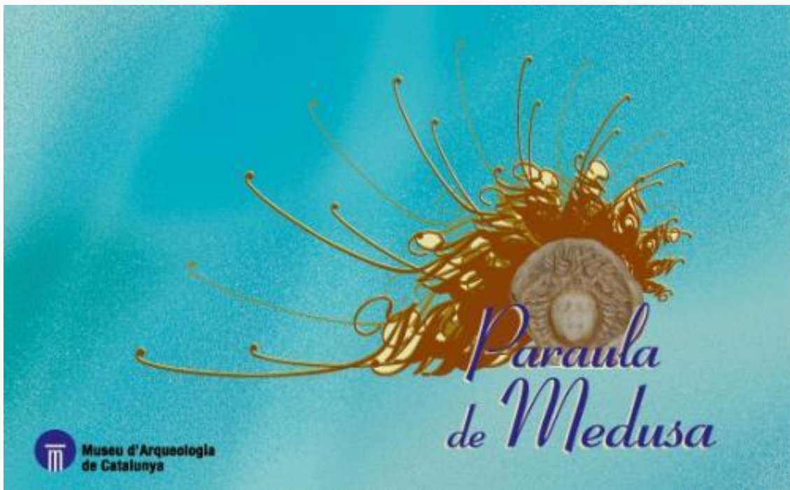
Figura 8 – Portada de l'exposició Paraula de Medusa .