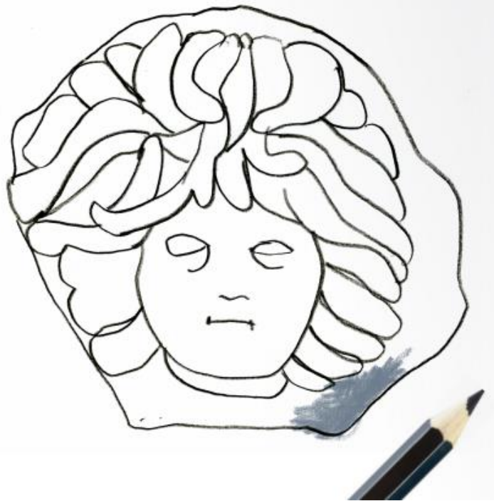
Figura 7 – Extracte del tríptic didàctic on es fa referència a la Medusa com a símbol del Museu.