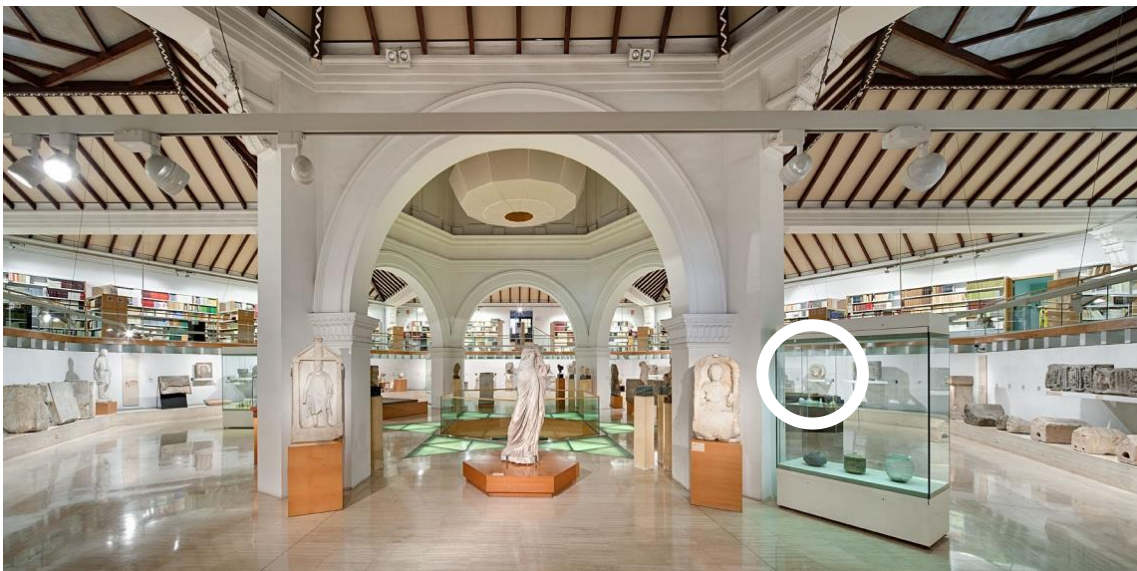
Figura 4 – Vista general de la sala XIV del Museu d'Arqueologia de Catalunya. Dins del cercle blanc, la Medusa original.