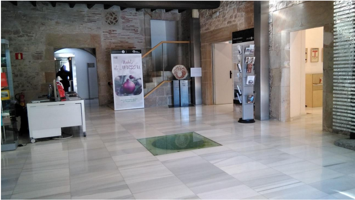
Figura 3 – Vestíbul de l'Harmonia, seu d'art del Museu de l'Hospitalet. Al fons, la reproducció de la Medusa exposada. Font: pròpia, 27/12/2017.