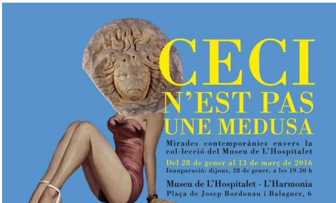
Figura 9 – Cartell promocional de l'exposició Ceci n'est pas une medusa .