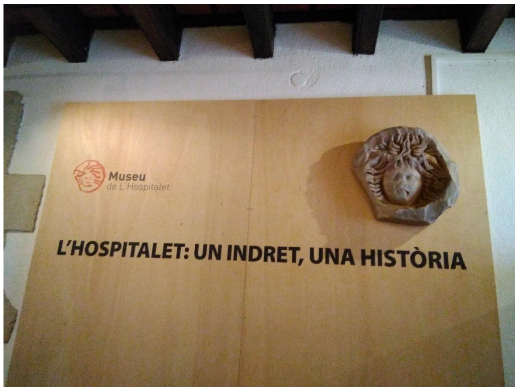
Figura 6 – A mà dreta, reproducció de la Medusa presidint l'exposició permanent de Casa Espanya. Font: pròpia, 27/12/2017.