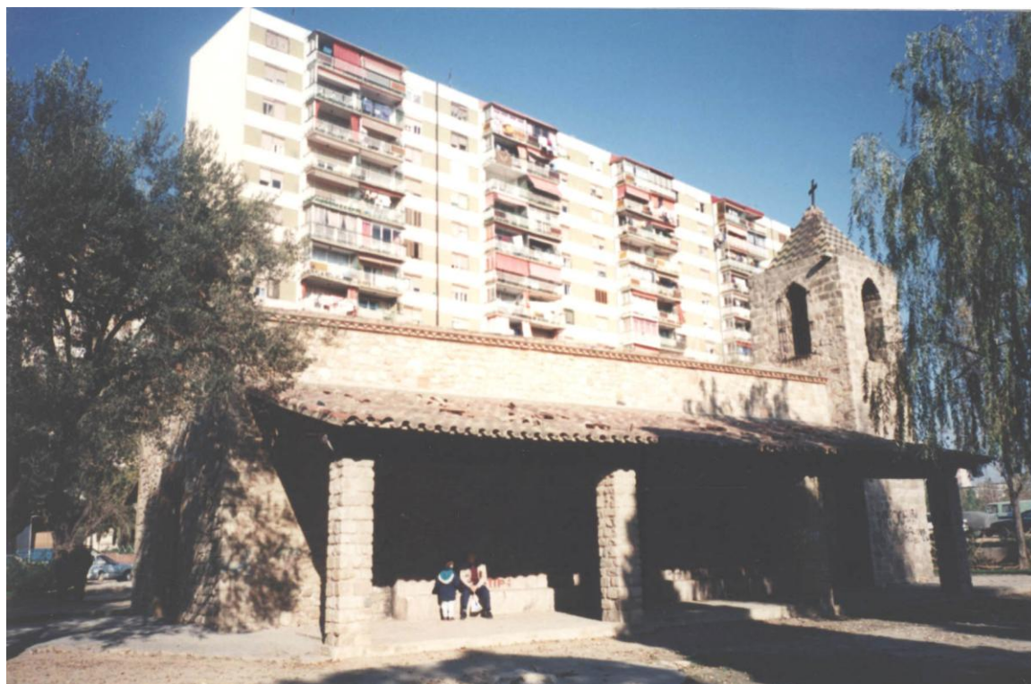
Porxo afegit al 1959