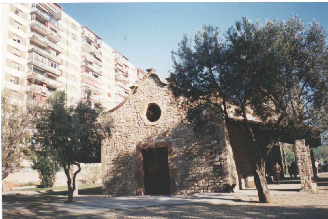
Façana barroca de l'ermita (Desembre 1994)