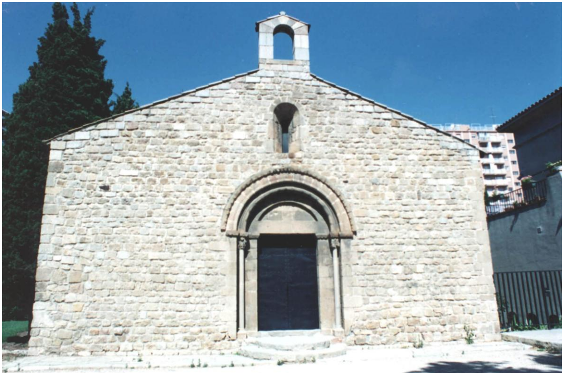
Vista de la façana principal de l' ermita ( Abril 1996 )