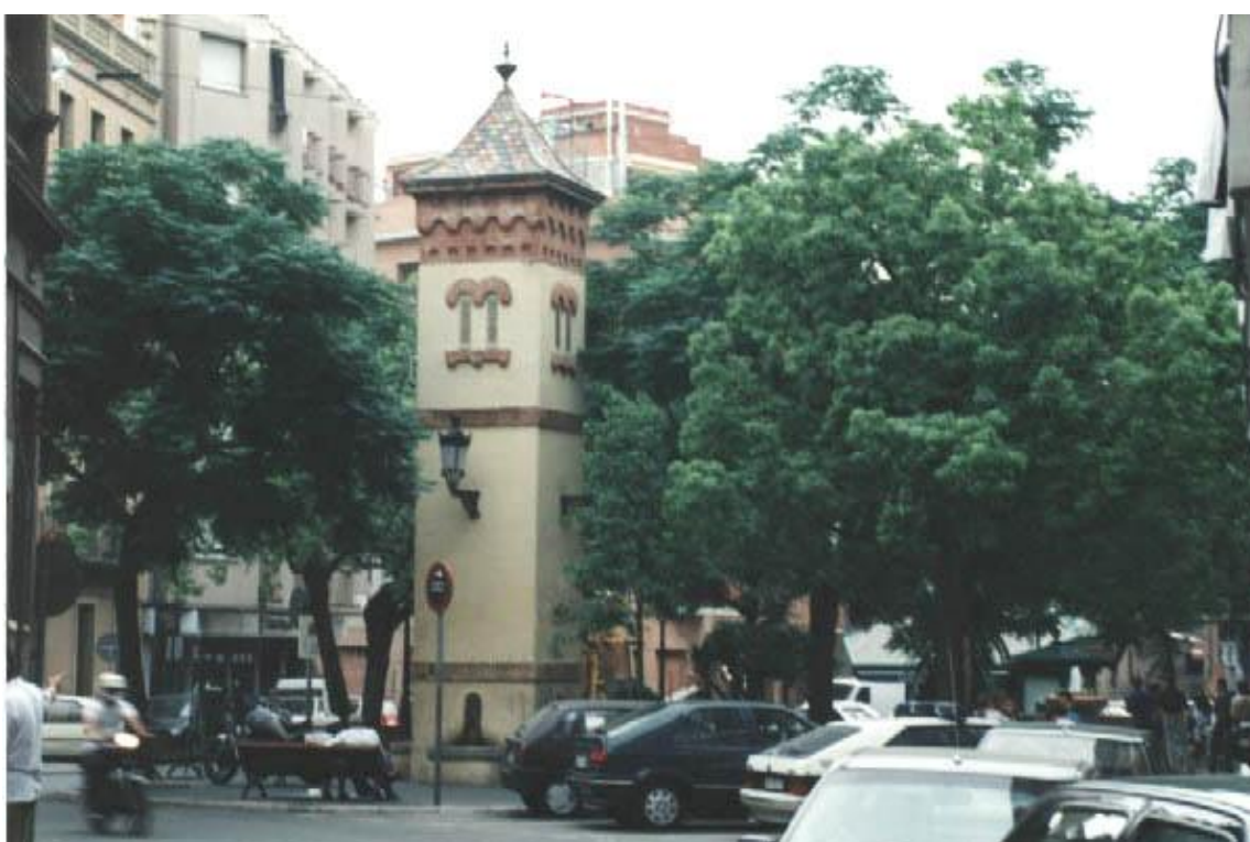
Estat actual de la font del Repartidor ( Novembre 1994 )