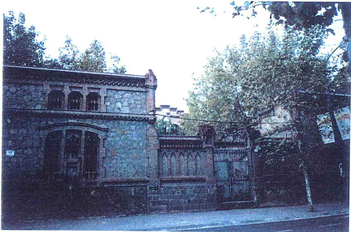
Accés al recinte ( Octubre 1994 )

Generalitat de Catalunya Departament de Política Territorial i Obres Públiques