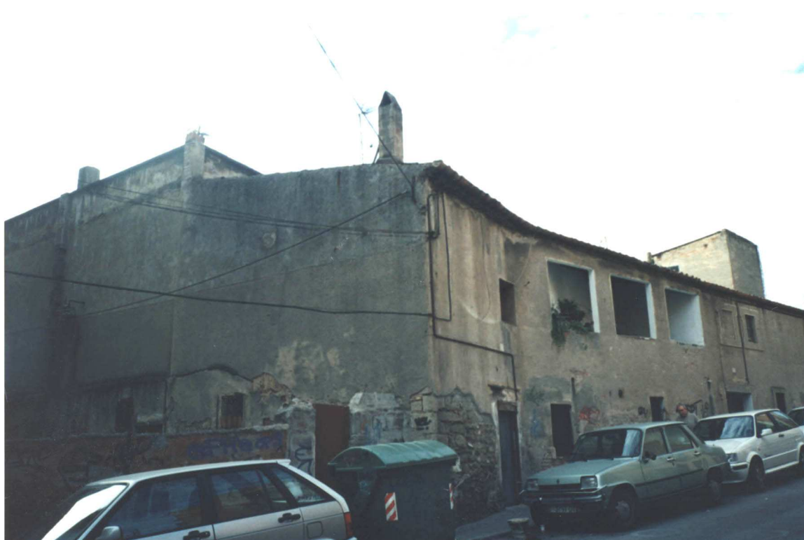
Vista general de la façana ( Desembre 1994 )