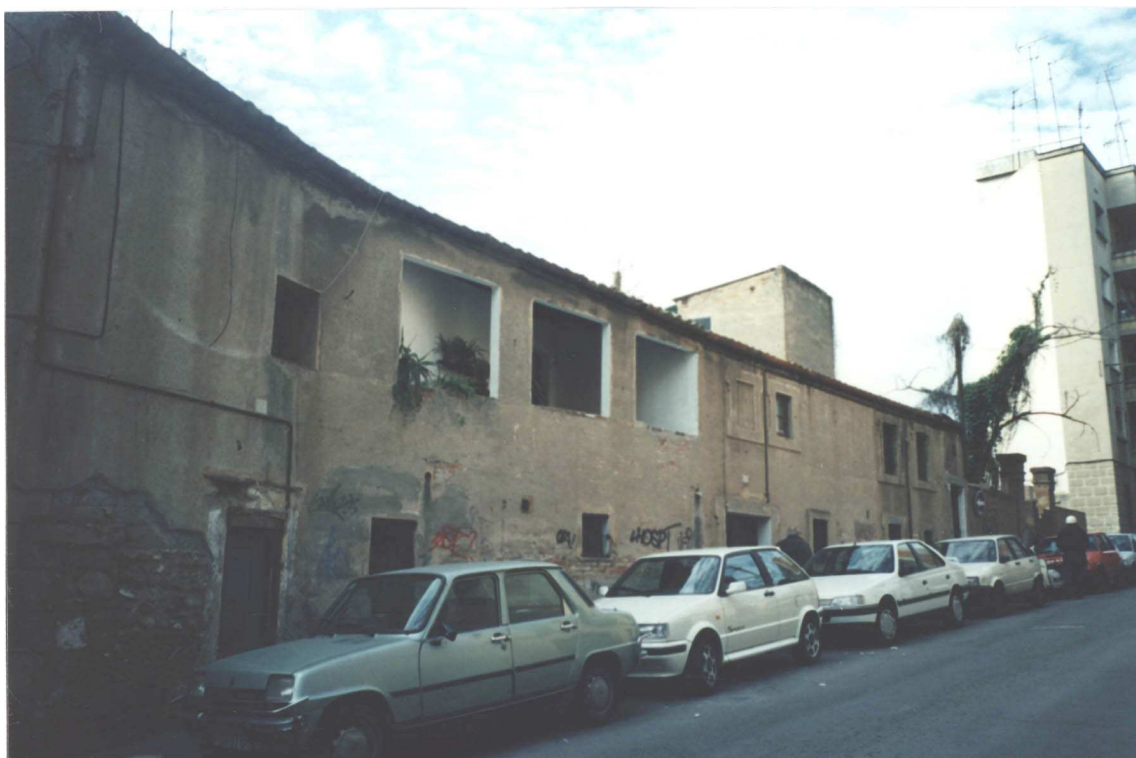
Vista general de la façana ( Desembre 1994 )