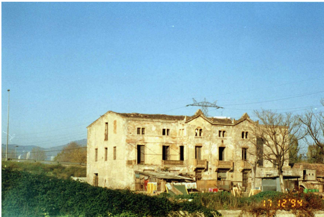
Vista general de la masia ( Desembre 1994 )