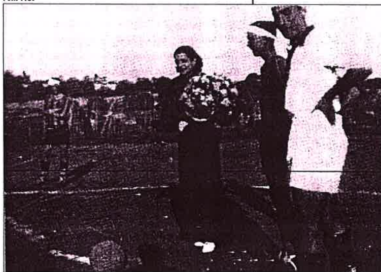
L'esport en la dècada dels trenta ja és popular. Aquí veiem miss Hospitalet 1935 fent la sacada d'honor d'un partit entre el Centre d'Esports Hospitalet i l'Atlètic Club Catalunya, al camp del camí de la Fonteta, durant l'aniversari de la República, el 14 d'abril