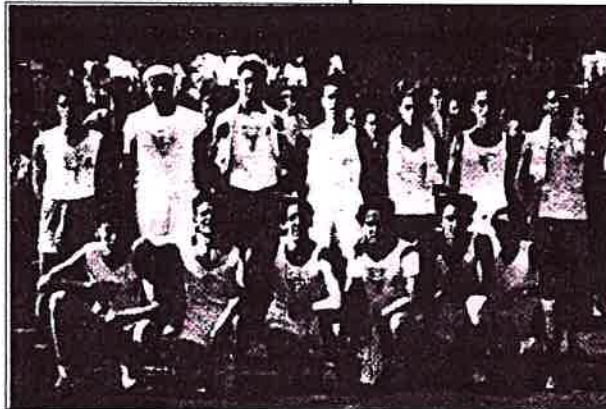
Equips de l'Atlas i del Juniors que van inaugurar la pista de la rambla Just Oliveras, l'any 1932.