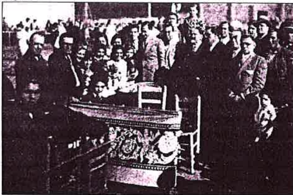
Inauguració del camp de bàsquet del Juniors, a la rambla Just Oliveras, l'any 1932. Assistiren les autoritats